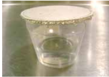
Prueba de Permeabilidad

Las siguientes especificaciones corresponden a metodologías de pruebas internas basadas en estándares aplicables a los Sistemas EIFS y cumplen con las necesidades típicas para esta familia de productos. El cumplimiento de estas especificaciones asegura obtener un correcto desempeño del producto a largo plazo y garantiza la prevención de problemas que pueden mantenerse ocultos por mucho tiempo como lo es el acumulamiento paulatino de humedad en las partes internas de muros, fachadas, etc.