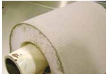
Prueba de Resistencia a la flexión