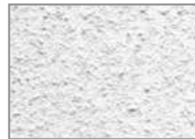
Cáscara de Naranja